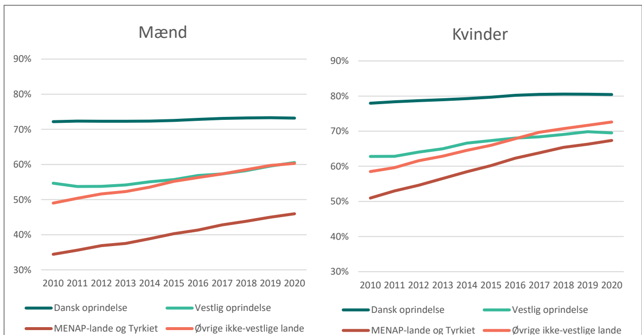
Figur 2: Andelen af 25-39-årige indvandrere (ankommet som 0-12-årige), efterkommere og personer med dansk oprindelse, der har gennemført en dansk erhvervskompetencegivende uddannelse fordelt på oprindelse og køn, 2010-2020, pct.

Anm.: Erhvervskompetencegivende uddannelse omfatter erhvervsfaglig, kort, mellemlang og lang videregående uddannelse samt bacheloruddannelse.